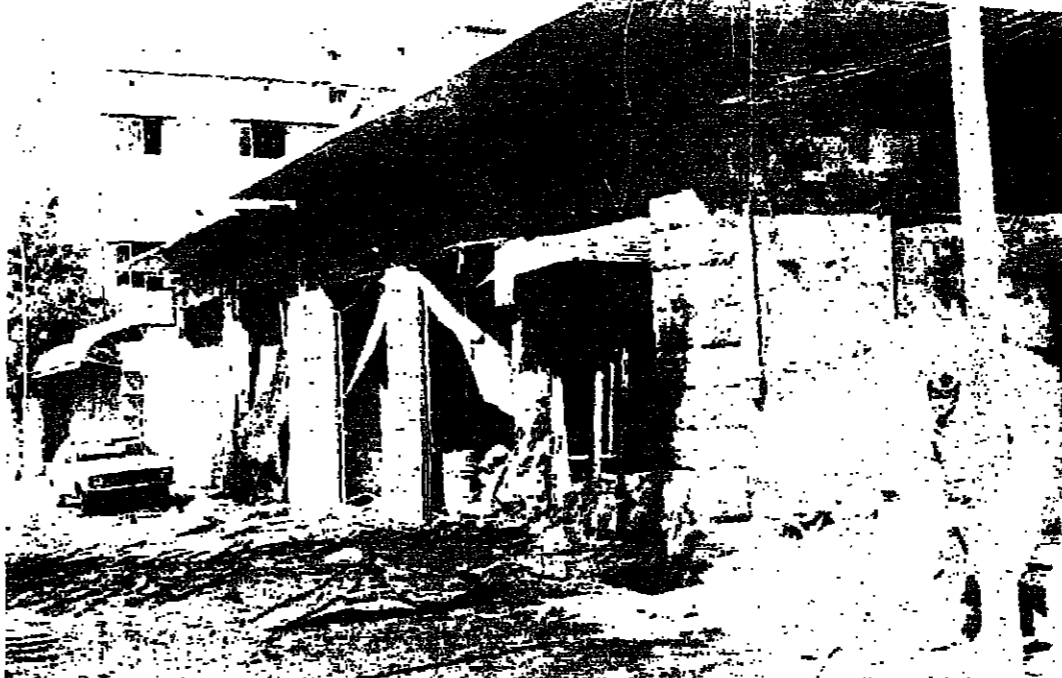
محلات ساعد في حوش الآراء بعد تسفها مع عدد من المحلات المجاورة

تمت شركة م. عزت جلا وأولاده بيزيد الأسى الموقوف على شبابه المرحوم